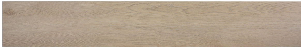
188866 QUERCIA TOSTADI 183.3X122 CM