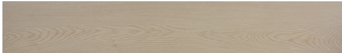
188865 QUERCIA NATURALE 183.3X122 CM