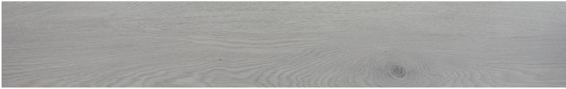
188863 QUERCIA GRIGIO 183.3X122 CM